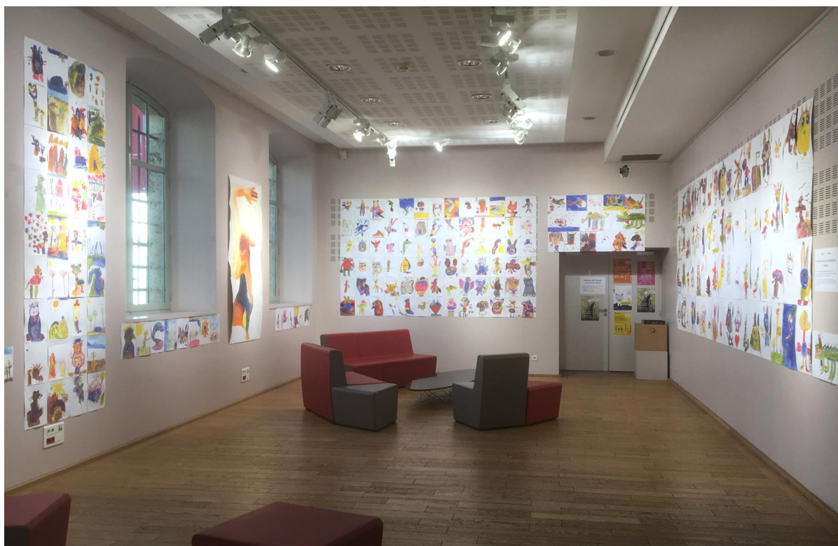
Vue de la restitution des réalisations des classes ayant participé au projet pédagogique « ANIMAL » encadré par Louise Duneton présentée du lundi 25 mars au lundi 15 avril 2019 à l'ECLA

D'autres collaborations peuvent être envisagées en fonction des demandes des enseignant(e)s/professeurs (programme scolaire, projet éducatif, thématique). L'Artothèque étudiera toute nouvelle proposition.