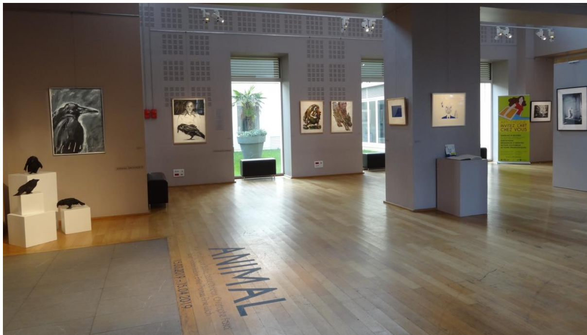
Vue de l'exposition ANIMAL, mars/avril 2019

En parallèle de sa mission de diffusion de l'art contemporain par le prêt d'œuvres, l'Artothèque propose une programmation d'expositions temporaires, à caractère monographique ou thématique, qui donnent à voir le travail de jeunes artistes au sein de l'espace d'exposition de l'ECLA.