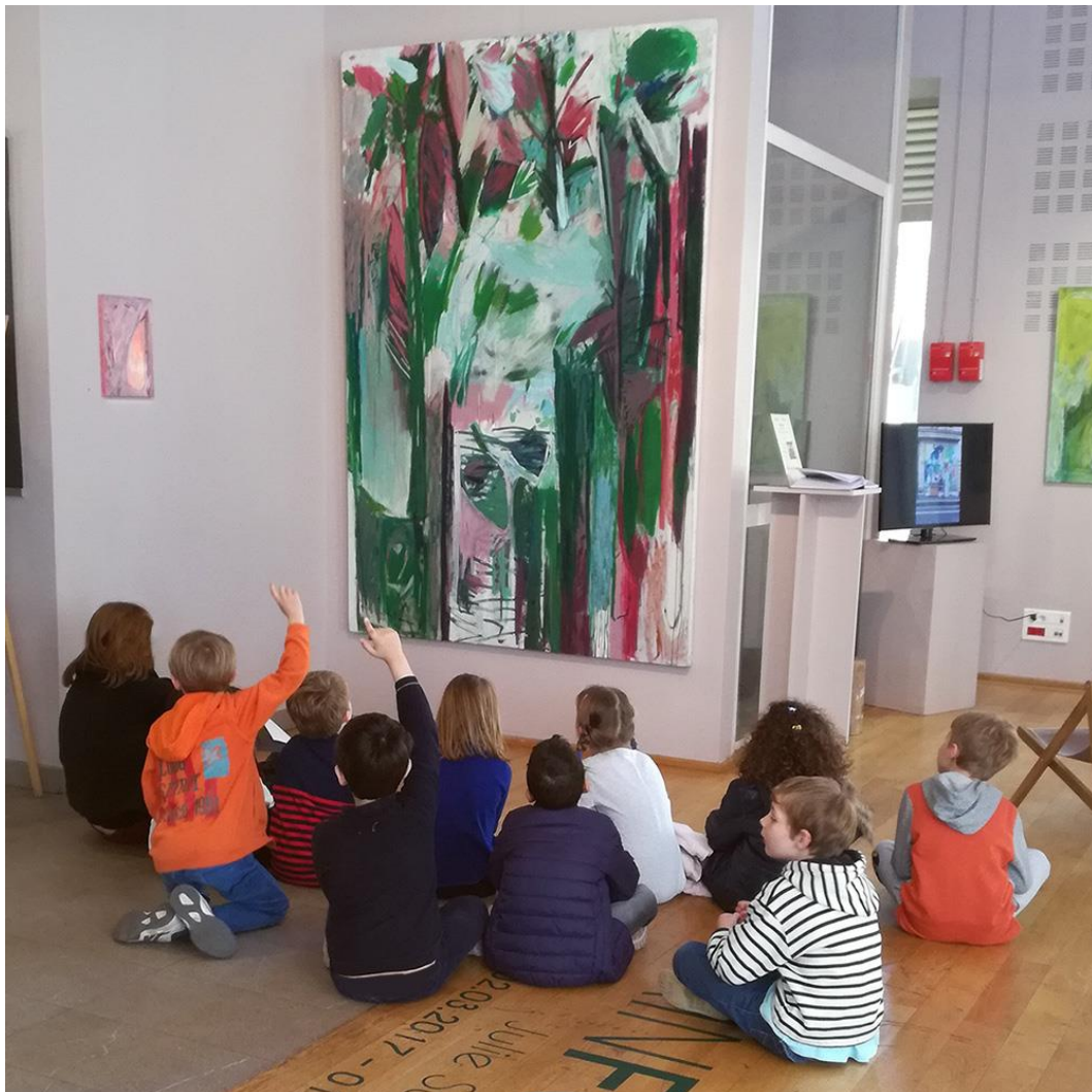
Visite de l'exposition Rainforest, mars 2017

Sur demande et en fonction de la disponibilité des artistes, une rencontre peut être envisagée avec la classe.