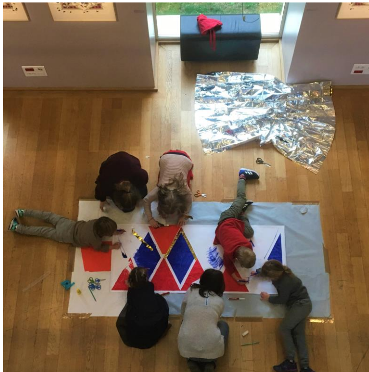
Atelier jeune public « Frise médiévale », exposition Apocalypse médiatique , novembre 2018