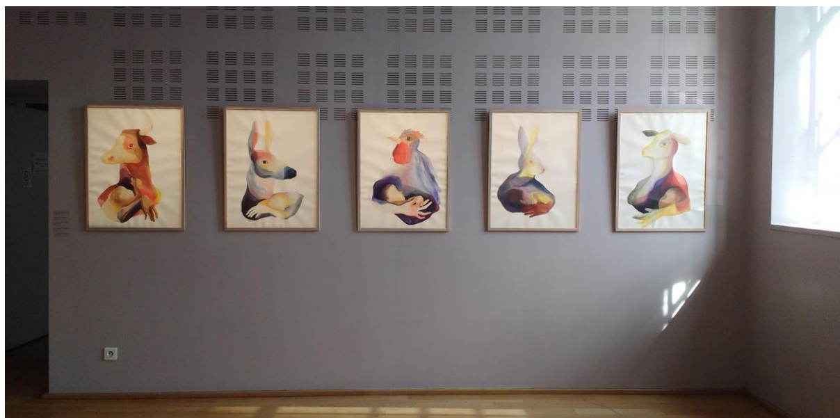
Dessins réalisés par la dessinatrice Louise Duneton lors de sa résidence de création à l'ECLA en février/mars 2019 : série « Animal à l'enfant », encres sur papier, 80 x 60 cm pour chaque dessin.

Dans une démarche de soutien à la création contemporaine, un artiste est invité à chaque saison en résidence dans le cadre d'un projet d'exposition.