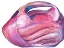
Palmand (série Triptyque-Diptyque), 2017, 29,5 x 15 cm, peinture acrylique sur feuille à dessin © julie hans vazquez

Actions pédagogiques 2019/2020 Cycles 1, 2 et 3 - Secondaire