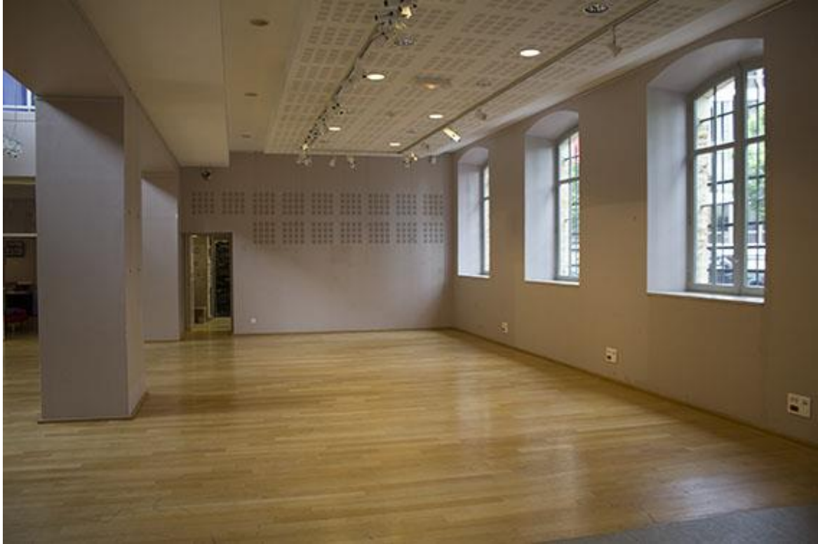
Espace d'exposition côté rue