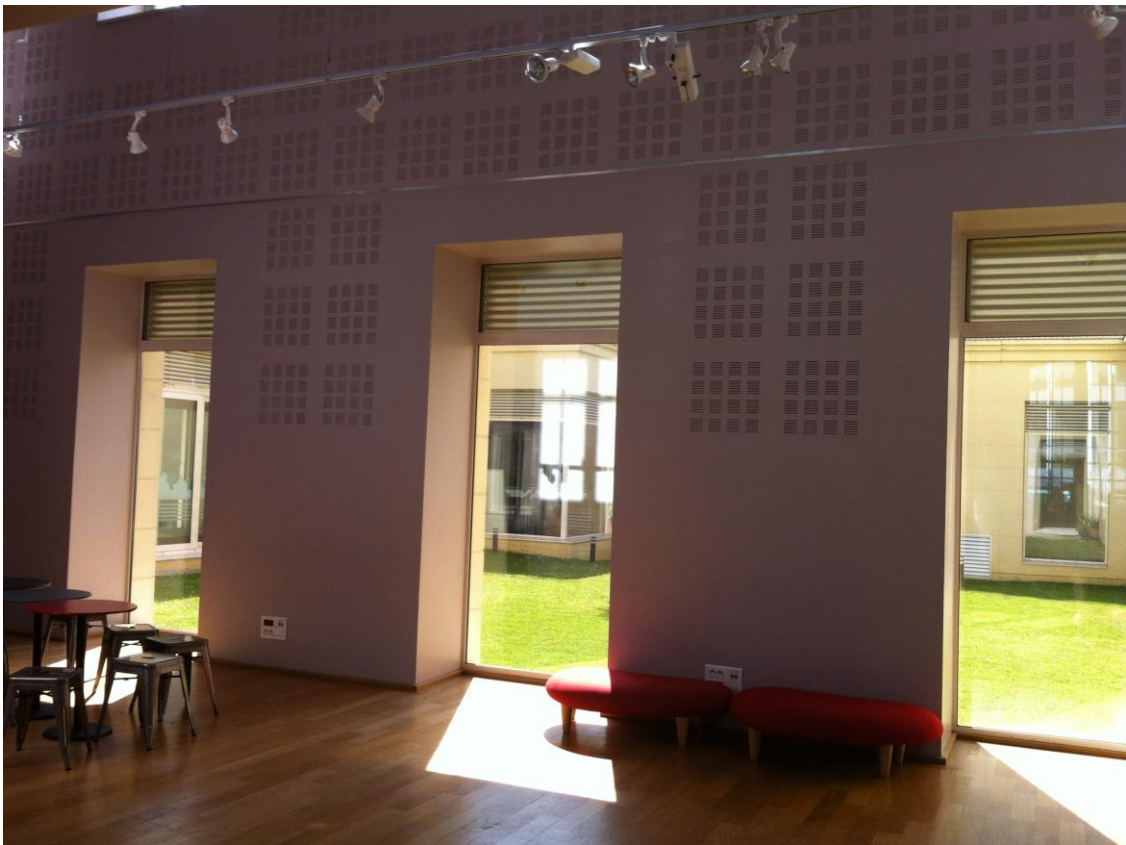
Espace d'exposition côté patio